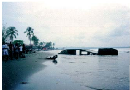
Spiaggia di Tumaco