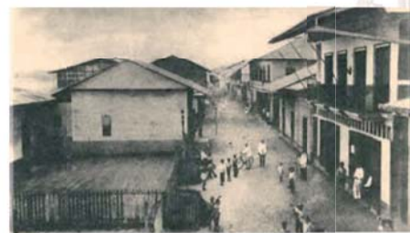
Tumaco come si presentava ai tempi del Miracolo nel 1906