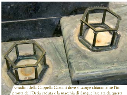
Gradini della Cappella Caetani dove si scorge chiaramente l'impronta dell'Ostia caduta e la macchia di Sangue lasciata da questa