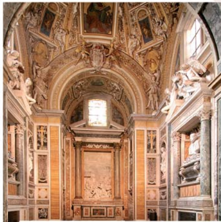
Interno della Chiesa