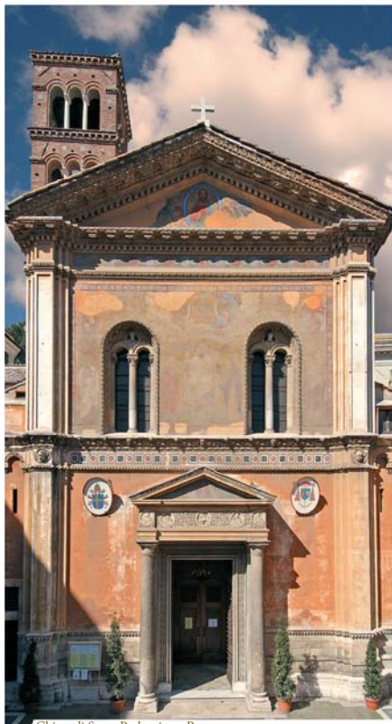
Chiesa di Santa Pudenziana, Roma