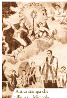
Antica stampa che raffigura il Miracolo