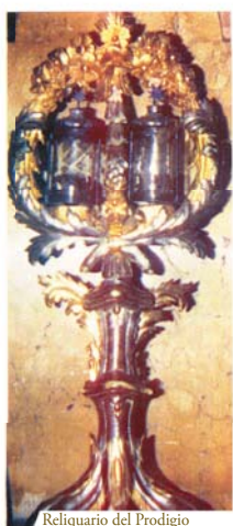
Reliquario del Prodigio