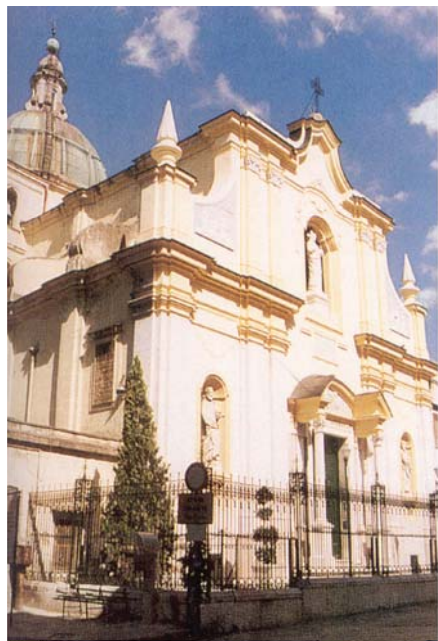
Chiesa di San Pietro, Patierno