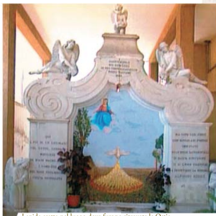
Lapide eretta nel luogo dove furono ritrovate le Ostie