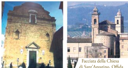
Facciata della Chiesa di Sant'Agostino, Offida