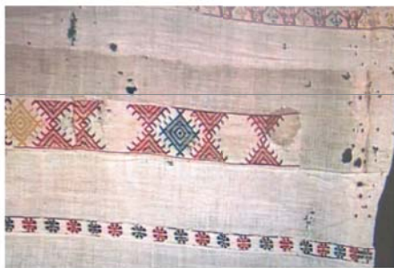
Particolare del lino insanguinato