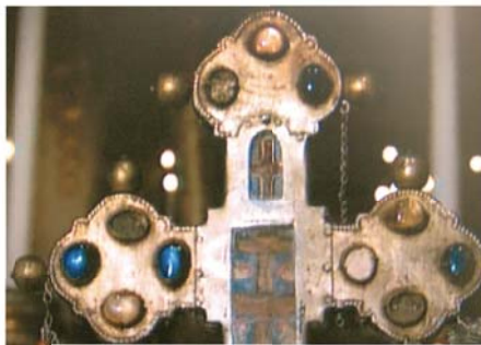
Immagine ingrandita della Reliquia dell'Ostia contenuta in questa preziosa Croce, opera di un orafo veneziano (XIII secolo)

Ad Offida, presso la chiesa di Sant'Agostino si conservano le Reliquie del Miracolo Eucaristico avvenuto nel 1273 in cui l'Ostia si convertì in carne sanguinante. Numerosi sono i documenti che descrivono il Prodigio tra cui una copia autentica di una pergamena del sec. XIII, scritta dal notaio Giovanni Battista Doria nel 1788. Vi sono inoltre numerose bolle di Papi a cominciare da quella di Bonifacio VIII (1295), a quella di Sisto V (1585), interventi di Congregazioni romane, decreti vescovili, statuti comunali, doni votivi, lapidi, affreschi e testimonianze di insigni storici tra cui ricordiamo l'Antinori e il Fella.