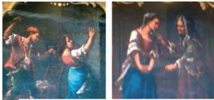
Affreschi presenti nella chiesa che illustrano il Miracolo.