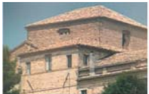
Convento con annessa la Chiesa di San Francesco, dove avvenne il Prodigio