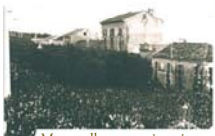
Morrovalle, processione in onore del Miracolo