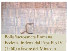
Bolla Sacrosancta Romana Ecclesia, indetta dal Papa Pio IV (1560) a favore del Miracolo