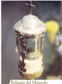
Reliquia del Miracolo