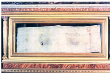
Reliquia del Corporale insanguinato