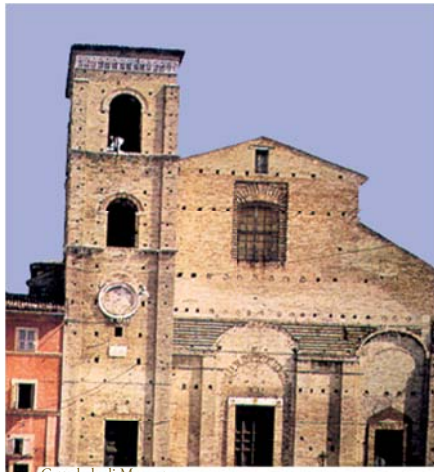
Cattedrale di Macerata