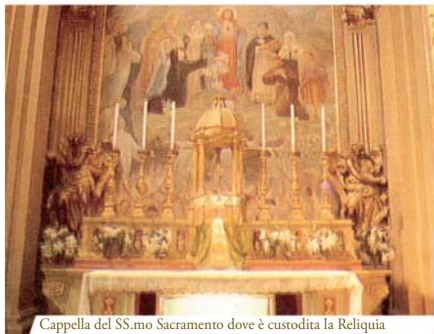
Cappella del SS.mo Sacramento dove è custodita la Reliquia