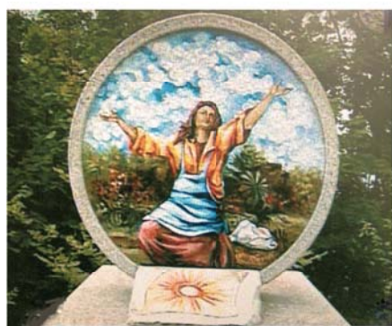
Grande cippo costruito a ricordo del Miracolo e della rappacificazione tra Gruaro e Valvasone