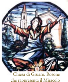
Chiesa di Gruaro. Rosone che rappresenta il Miracolo