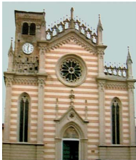
Nella Chiesa del SS. Corpo di Cristo, a Valvasone, è custodita la tovaglia di lino insanguinata