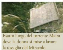
Esatto luogo del torrente Maira dove la donna si mise a lavare la tovaglia del Miracolo