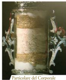
Particolare del Corporale