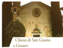
Chiesa di San Giusto a Gruaro