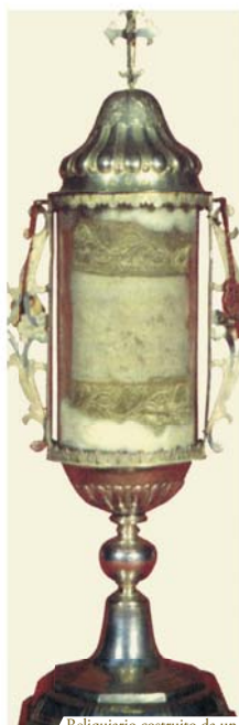
Reliquiario costruito da un orafco di Venezia nel 1755