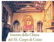
Interno della Chiesa del SS. Corpo di Cristo