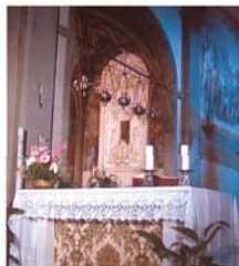
Reliquia delle Ostie sopravvissute all'incendio