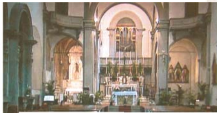
Interno della Basilica di Sant' Ambrogio