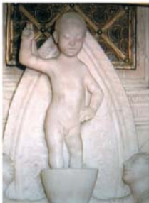
Particolari delle decorazioni presenti nel tabernacolo dove sono custodite le Reliquie dei due Miracoli Eucaristici