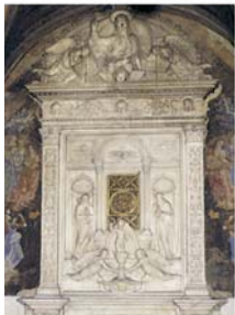
Prezioso tabernacolo, opera di Mino da Fiesole, dove si conservano le Reliquie dei due Miracoli

Il sangue fu subito raccolto in un' ampolla di cristallo. L'altro Miracolo Eucaristico avvenne il Venerdì Santo dell'anno 1595, quando, scoppiato un furioso incendio nella chiesa, restarono prodigiosamente intatte alcune Particole consacrate.