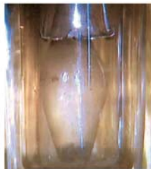
Reliquia delle gocce di vino trasformate in vivo Sangue