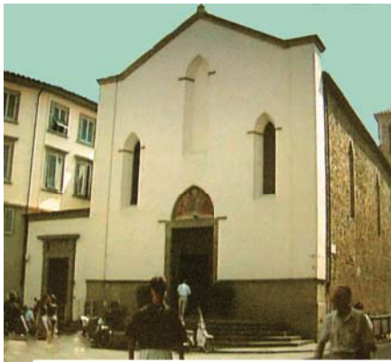
Basilica di Sant' Ambrogio, Firenze