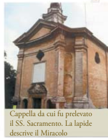
Cappella da cui fu prelevato il SS. Sacramento. La lapide descrive il Miracolo

Nel 1631, una giovane contadina, poco prudentemente, appiccò il fuoco a della paglia secca e da questa divampò subito un incendio che per il forte vento invase tutto il borgo della cittadina di Dronero. Tutti i tentativi di domare il fuoco si rivelarono inutili. Solo dopo che il Padre Maurizio da Ceva impartì la benedizione con il SS. Sacramento, l'incendio cessò miracolosamente.