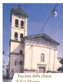
Facciata della chiesa di San Mauro