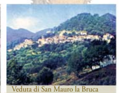
Veduta di San Mauro la Bruca