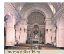
Interno della Chiesa

Nel 1969, a San Mauro la Bruca ignoti ladri, penetrati di nascosto nella chiesa parrocchiale, si impossessarono di alcuni oggetti sacri, tra cui la pisside contenente delle Particole consacrate. Le Ostie furono ritrovate la mattina seguente e ancora oggi si mantengono intatte.