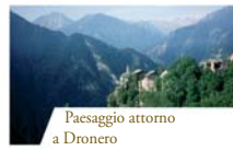
Paesaggio attorno a Dronero