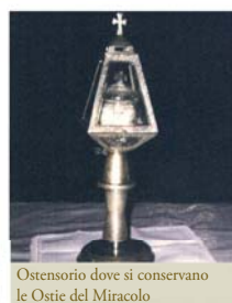
Ostensorio dove si conservano le Ostie del Miracolo

Nel 1969, a San Mauro la Bruca ignoti ladri, penetrati di nascosto nella chiesa parrocchiale, si impossessarono di alcuni oggetti sacri, tra cui la pisside contenente delle Particole consacrate. Le Ostie furono ritrovate la mattina seguente e ancora oggi si mantengono intatte.