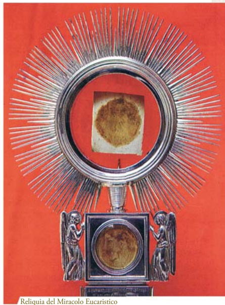
Reliquia del Miracolo Eucaristico