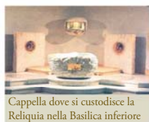
Cappella dove si custodisce la Reliquia nella Basilica inferiore