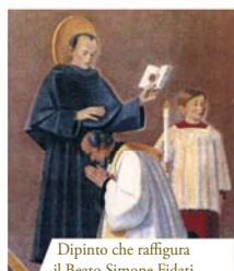
Dipinto che raffigura il Beato Simone Fidati