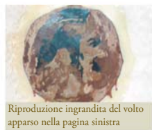
Riproduzione ingrandita del volto apparso nella pagina sinistra