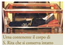
Urna contenente il corpo di S. Rita che si conserva intatto