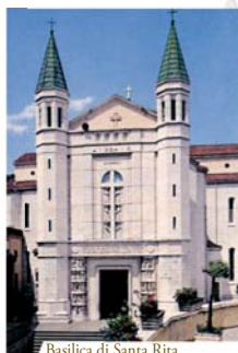
Basilica di Santa Rita

Nel 1330, a Cascia un contadino gravemente ammalato fece chiamare il prete per ricevere la Comunione. Il sacerdote, un po' per incuria e un po' per apatia, invece di prendere con sé il ciborio per riporre la Particola da portare a casa del malato, prelevò da questo un'Ostia che infilò irriverentemente nel libro delle preghiere. Una volta giunto dal contadino, il sacerdote aprì il libro e con spavento vide che l'Ostia si era trasformata in un grumo di sangue che aveva macchiato anche le pagine del libro.