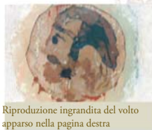
Riproduzione ingrandita del volto apparso nella pagina destra