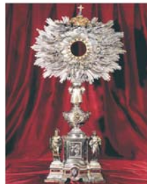
Antico Ostensorio che conteneva la Reliquia del Miracolo