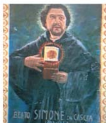
BEATO SIMONE DI CASCIA