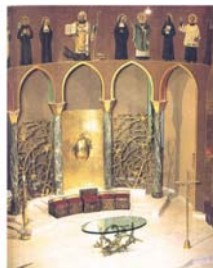
Basilica superiore con presbiterio dello scultore Manzù