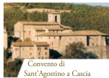
Convento di Sant'Agostino a Cascia