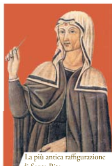
La più antica raffigurazione di Santa Rita