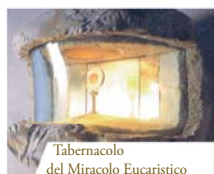
Tabernacolo del Miracolo Eucaristico