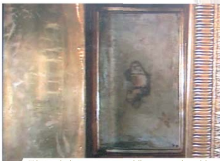
Tabernacolo dove si conserva una delle pietre macchiate dal Sangue del Prodigio, Bolsena