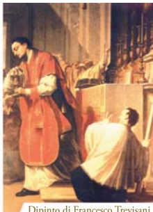
Dipinto di Francesco Trevisani