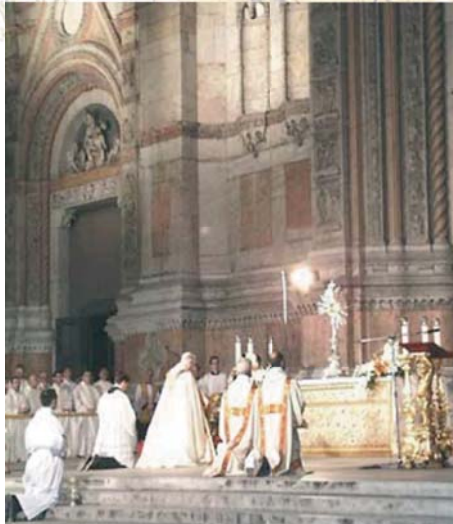
Adorazione pubblica in onore della festa del Corpus Domini, Orvieto