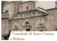
Cattedrale di Santa Cristina a Bolsena