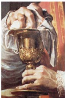
Francesco Trevisani. Il Miracolo di Bolsena, particolare