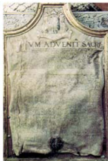
Pergamena d'epoca sul Miracolo del notaio Cesare Severo Durantino