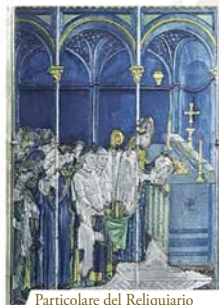
Particolare del Reliquario