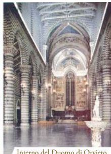
Interno del Duomo di Orvieto