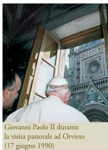
Giovanni Paolo II durante la visita pastorale ad Orvieto (17 giugno 1990)