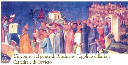
L'incontro sul ponte di Riochiaro, (Ugolino d'Ilario). Cattedrale di Orvieto