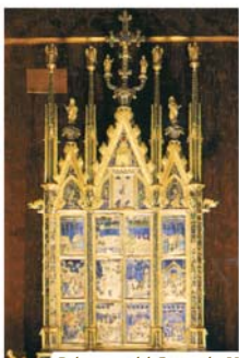
Reliquario del Corporale, Ugolino di Vieri e soci (1338), Orvieto