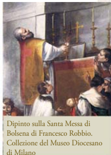
Dipinto sulla Santa Messa di Bolsena di Francesco Robbio. Collezione del Museo Diocesano di Milano

«Improvvisamente quell'Ostia apparve, in modo visibile, vera carne e aspersa di rosso sangue [...]».