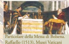
Particolare della Messa di Bolsena. Raffaello (1513), Musei Vaticani