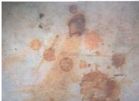
Particolare della pietra macchiata di Sangue, Bolsena