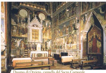
Duomo di Orvieto, cappella del Sacro Corporale

«Improvvisamente quell'Ostia apparve, in modo visibile, vera carne e aspersa di rosso sangue [...]».