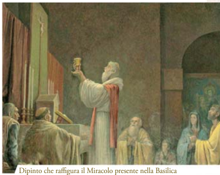
Dipinto che raffigura il Miracolo presente nella Basilica