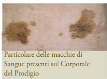
Particolare delle macchie di Sangue presenti sul Corporale del Prodigio