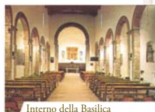
Interno della Basilica

Nel 1412, l'allora priore della Basilica di Santa Maria di Bagno di Romagna, Padre Lazzaro da Verona, mentre celebrava la Santa Messa, fu assalito da forti dubbi circa la reale presenza di Gesù nel SS. Sacramento. Aveva da poco pronunciato le parole della consacrazione sul vino che questo si trasformò in vivo sangue e cominciò a ribollire fuoriuscendo dal calice e riversandosi sul corporale. Padre Lazzaro, profondamente commosso e pentito, confessò ai fedeli presenti alla celebrazione la sua incredulità e lo strepitoso Miracolo che il Signore aveva operato sotto il suo sguardo.