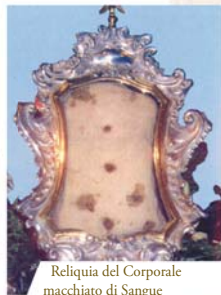
Reliquia del Corporale macchiato di Sangue