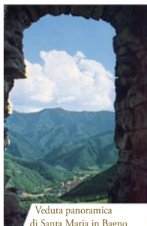
Veduta panoramica di Santa Maria in Bagno