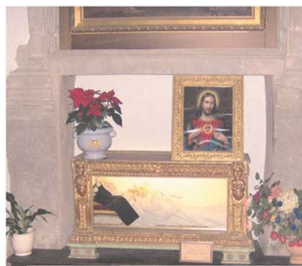
Cappella con l'urna della Beata Giovanna