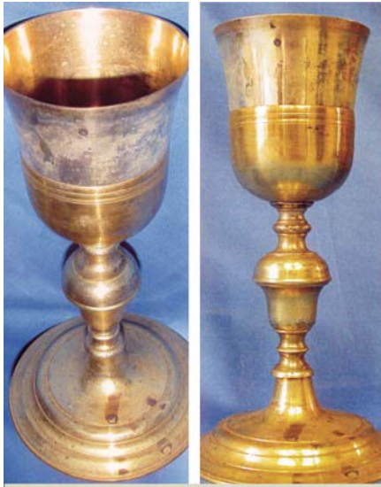
Opera Pia Miliavacca, Calice del Miracolo del 1718. Osservare la corrispondenza delle gocce di Sangue sulla coppa e sul piede del calice