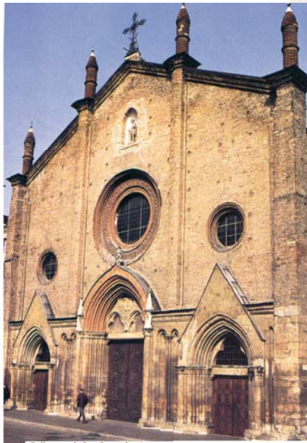
Collegiata di San Secondo, Asti

In ambedue i Miracoli Eucaristici di Asti, dall'Ostia consacrata sprizzò vivo sangue. Numerosi sono i documenti che confermano i due Prodigii. Nel primo Miracolo il Vescovo di Asti, Mons. Scipione Roero, fece subito redigere un atto notarile, e il Papa Paolo III, con un Breve datato 6 novembre 1535, accordò l'indulgenza plenaria a chiunque avesse visitato la chiesa di San Secondo nel giorno dell'anniversario del Prodigio.