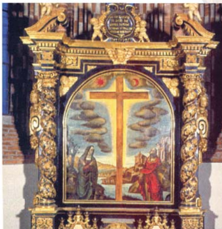
G. Badarello (fine XVII secolo), Collegiata di San Secondo, altare del Crocifisso o del Miracolo