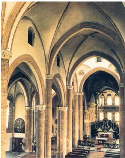
Interno della Collegiata di San Secondo

In ambedue i Miracoli Eucaristici di Asti, dall'Ostia consacrata sprizzò vivo sangue. Numerosi sono i documenti che confermano i due Prodigii. Nel primo Miracolo il Vescovo di Asti, Mons. Scipione Roero, fece subito redigere un atto notarile, e il Papa Paolo III, con un Breve datato 6 novembre 1535, accordò l'indulgenza plenaria a chiunque avesse visitato la chiesa di San Secondo nel giorno dell'anniversario del Prodigio.