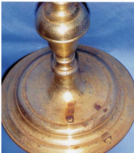
Particolare del piede del calice del Miracolo dell'Opera Pia Milliavacca