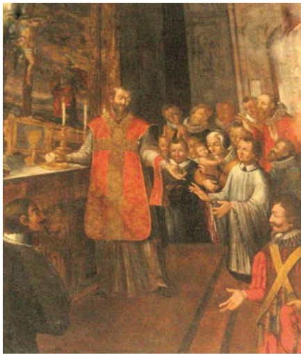
Olio su tela (autore ignoto, secolo XVII), raffigurante il Prodigio Eucaristico avvenuto nella Collegiata di San Secondo nel 1535. Il dipinto si conserva nella Cappella del Miracolo