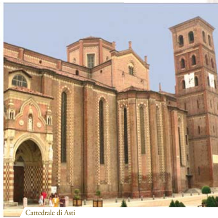
Cattedrale di Asti

Il secondo Miracolo avvenne invece nell'antica cappella dell'Opera Pia Milliavacca ed è documentato da numerose testimonianze raccolte da un notaio, sottoscritte dal sacerdote celebrante e da eminenti personalità ecclesiastiche e laiche.