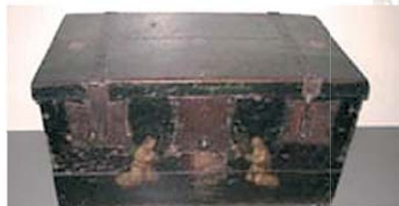
Cassetta che conteneva l'Ostia miracolosa