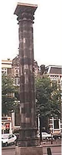
Colonna rimasta dopo l'incendio della Chiesa