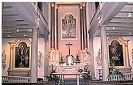
Cappella del SS. Sacramento