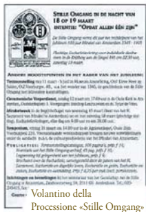
Volantina della Processione «Stille Omgang»

Nel 1452 la cappella fu distrutta da un incendio, ma stranamente l'Ostensorio contenente la Sacra Particola rimase intatto.