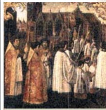
Antico dipinto che rappresenta una solenne processione in onore del Miracolo