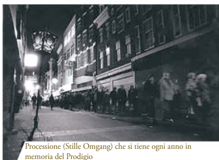
Processione (Stille Omgang) che si tiene ogni anno in memoria del Prodigio