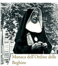
Monaca dell'Ordine delle Beghine