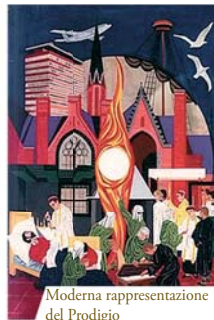
Moderna rappresentazione del Prodigio