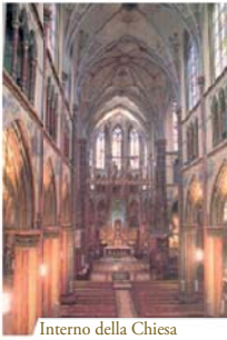
Interno della Chiesa