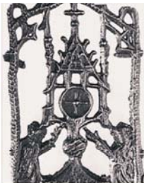
Scultura che raffigura l'antico Ostensorio che conteneva l'Ostia miracolosa