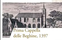
Prima Cappella delle Beghine, 1397