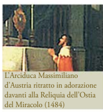
L'Arciduca Massimiliano d'Austria ritratto in adorazione davanti alla Reliquia dell'Ostia del Miracolo (1484)