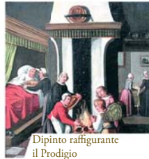
Dipinto raffigurante il Prodigio