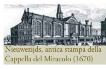
Nieuwezijds, antica stampa della Cappella del Miracolo (1670)