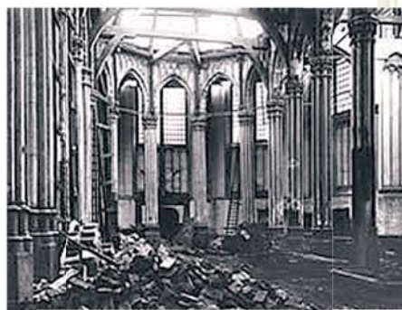
La Cappella della Chiesa fu di nuovo distrutta nel 1908