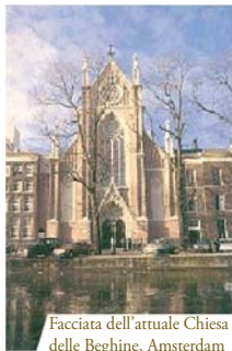
Facciata dell'attuale Chiesa delle Beghine, Amsterdam