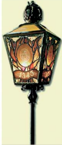
Lampada in cui è raffigurato il SS. Sacramento in onore della 1ª Processione «Stille Omgang» che si tiene per celebrare il Miracolo