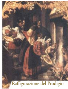
Raffigurazione del Prodigio